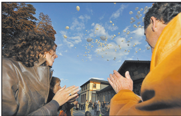
Hier à Saxon, la journée du souvenir a été marquée par un symbolique lâcher de ballons de l'espoir. HOFMANN