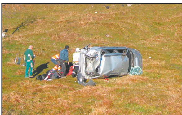
Le véhicule a quitté la route et dévalé un talus sur une distance d'environ 150 mètres.

A noter encore que, dans le cadre de ses 10 ans, la fondation a publié un dossier sur ses activités au service de la protection de l'enfance. Elle a également repositionné son site internet (www.sarahoberson.org) qui se veut désormais une plateforme de dialogue privilégiée pour toutes les personnes intéressées aux questions soulevées par la disparition, le deuil ou la maltraitance concernant des enfants.