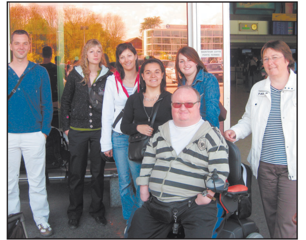
Les six élèves et leurs professeurs se sont rendus en Asie du Sud-Est du 18 au 26 avril pour tenter de mieux comprendre la problématique du tourisme accessible pour tous.

Des informations supplémentaires se trouvent sur le site www.oseo-vs.ch