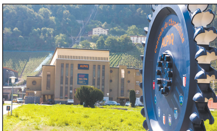
L'usine de Chandoline, l'un des fleurons d'Alpiq en Valais.

Le groupe a dévoilé à mi-février ses résultats 2009, avec à la clef un tassement de son bénéfice net de 7,7% par rapport à